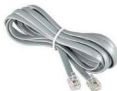
propojovací kabel RS232