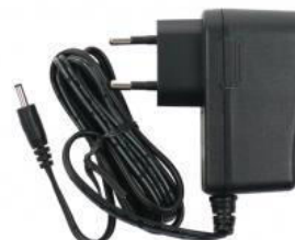
napájecí zdroj AD05/JACK