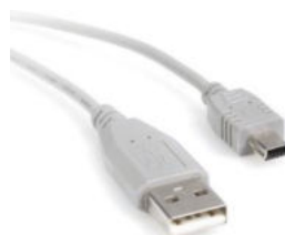
mini USB kabel