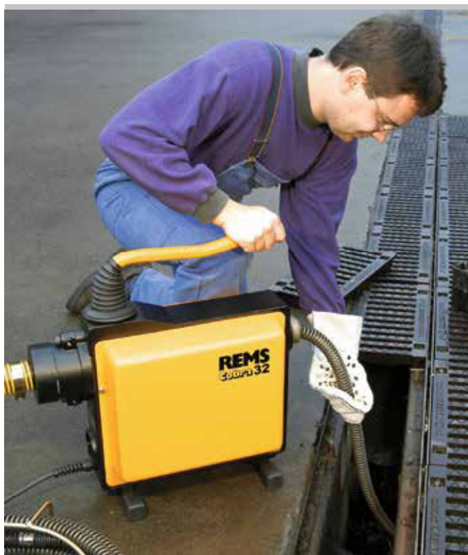
Kvalitní německý výrobek