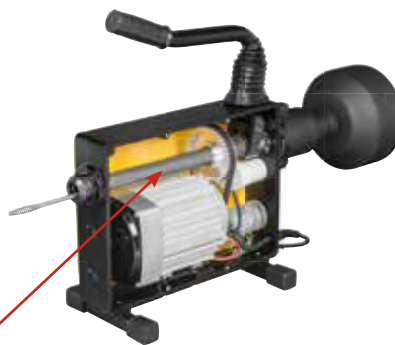
Průběžné, uzavřené pohonné vřeteno chrání motor a pohon před nečistotami a vodou