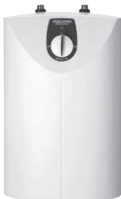
SNU 5 SL antitropf comfort