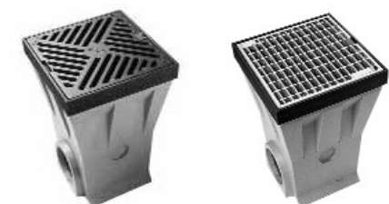
Pontszerű összefolyó öntöttvas és horganyzott acél hálós ráccsal