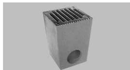
Udvari összefolyó horganyzott acél bordás ráccsal