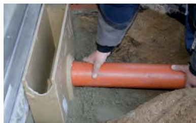
5. DN100 KG csövet sikosító anyaggal a bekötő aknához csatlakoztatni.