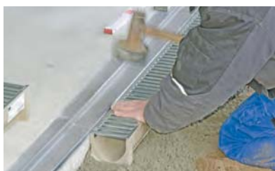
7. A folyókatest beépítése a bekötőaknához. A folyóka beépítésénél a 2 cm-es garázküszöböt úgy kell kialakítani, hogy a kapu a küszöb és a folyóka közt zárjon.