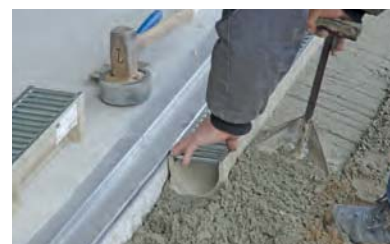
9. Oldalsó betontámaszt kialakítani a beépítési javaslat alapján.