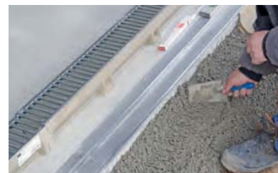
6. A betont felvinni a már tömített alapra.