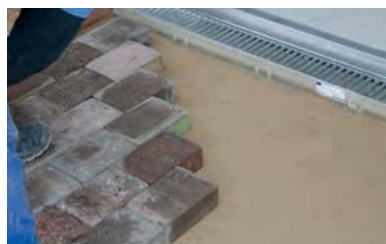
11. A burkolat beépítése a folyókához.