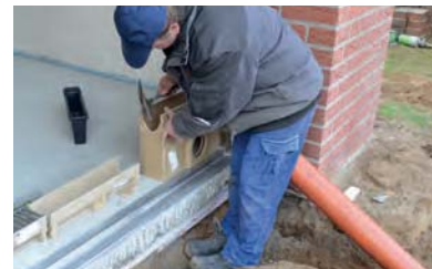
3. ...és kívülről befelé egy kalapáccsal kiütjük.