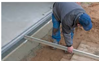
10. Meghatározni a burkolat lehetséges lejtését. A burkolatot úgy kell kialakítani, hogy a folyóka rács 3-5 mm-rel lejjebb fusson a burkolathoz képest.