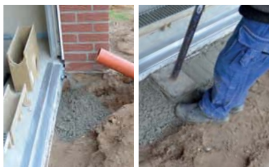
4. A betonágy elkészítése a beépítési javaslat szerint. A betonágy tömörítése. DN100 KG csőhálózat előkészítése.