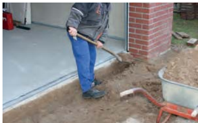
1. A talaj kiemelése az ACO Self® Euroline beépítési javaslata szerint: folyóka, bekötő aknával. (részletek letölthetőek: www.acoself.hu )

Az ACO Self® Euroline beépítése bekötőaknával garázs előtt, lépcsőről lépésre.