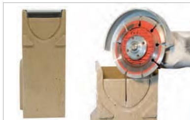
2. A folyóka test csatlakozásához a kigyöngítést egy gyémánttárcsás sarokcsiszoló segítségével végezzük, ahogy az ábrán is látszik: középen bevágjuk és...