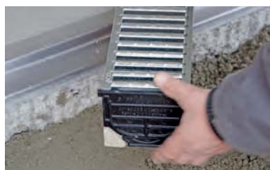
8. Az utolsó folyókatest behelyezése előtt a homloklap beépítése. (Lásd a 15. oldalt)